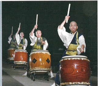
和太鼓集団 鼓司 KUSU 現役僧侶が打ち鳴らす禅の世界